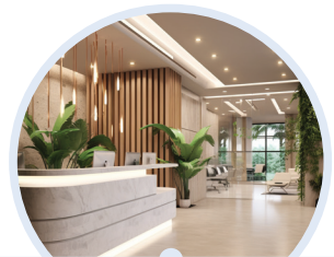
Espacios de oficina